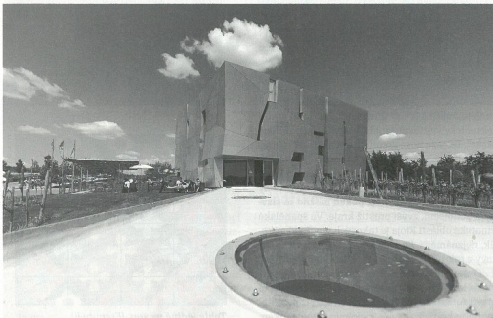
Továrna se střílnami. (Loisium od Stevena Holla)